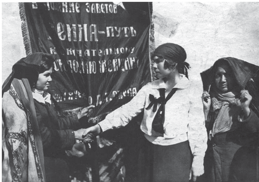
Долой паранджу. Ташкент — история одного города. Ташкент, 2009. С. 230.