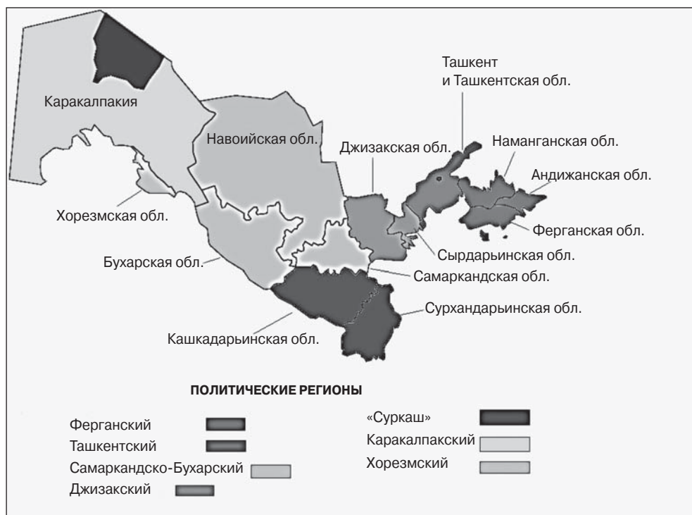
Рис. 3. Политические регионы Узбекистана 13

совместной карьеры в бюрократическом аппарате. Нередко эти факторы связаны друг с другом: семейные отношения во многих случаях возникают в районах совместного проживания, а дальние и близкие родственники, являющиеся одновременно выходцами из одной и той же местности, поддерживают один другого в бизнесе или карьере. Фактически такого рода кланы представляют собой иерархически организованную совокупность клиентелл, для которых характерны высокий уровень внутренней солидарности и лояльность по отношению к патронату. Принадлежность к ним является важным, а в ряде случаев необходимым условием для рекрутирования в элиту и продвижения по карьерной лестнице.