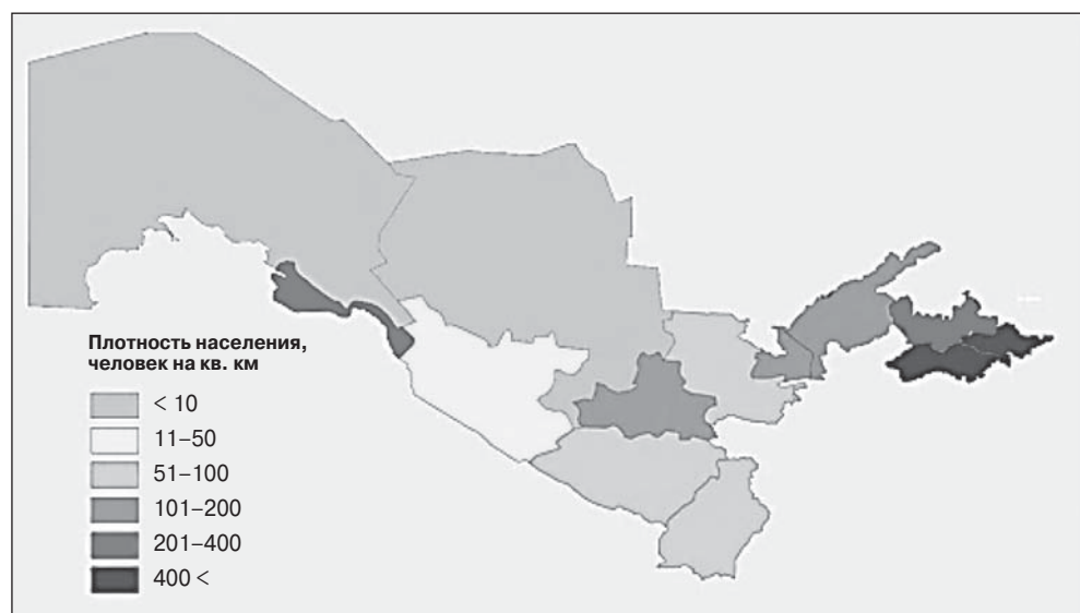
Рис. 4. Плотность населения областей Узбекистана

Для Ферганского региона характерны очень высокий уровень аграрного перенаселения (средняя плотность населения составляет 426 человек на квадратный километр, что почти в 7 раз выше средней по стране), склонность к традиционному образу жизни и высокая религиозность 15 . Ферганские узбеки считают себя чистыми узбеками , то есть в наименьшей степени смешанными с другими этническими группами — таджиками, киргизами, казахами и т.д. Исторически Ферганская долина была главным центром распространения ислама в Центральной Азии. В советский период там возник