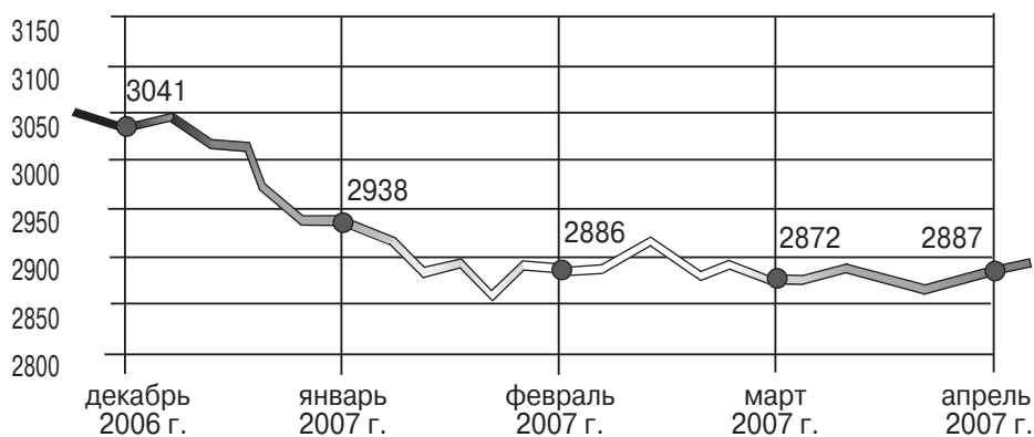
График 1. Индекс международной безопасности iSi (декабрь 2006 г. – апрель 2007 г.)