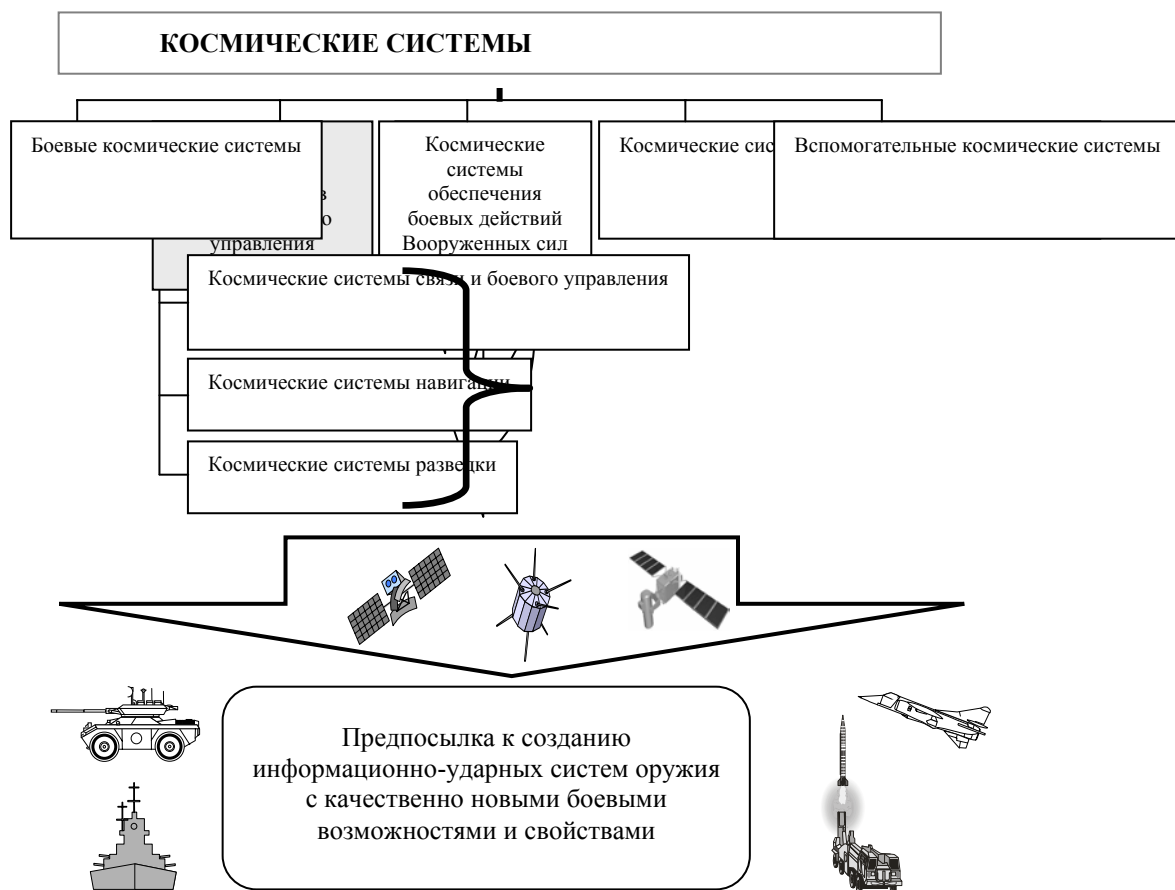
Рис. 1. Новый классификационный параметр в общей классификации космических систем

В связи с этим возникает вопрос: насколько соответствует развернувшийся процесс создания информационно-ударных систем оружия с наведением из космоса их поражающих элементов интересам мирового сообщества? Видимо целесообразно, чтобы этот вопрос решался путем международно-правового регулирования.