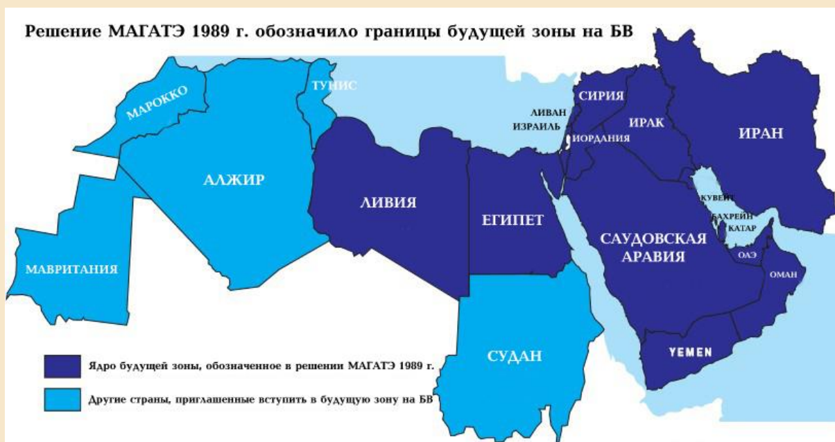
Рис. 2. Проект зоны, свободной от ОМУ, на Ближнем Востоке.

со стороны ядерных держав, это может стать дополнительным аргументом в пользу заключения сделки для стран региона.