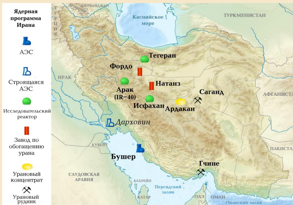
Рис. 1. Ядерная инфраструктура Ирана.

Цели американской и иранской администрации разделяют и внутренние игроки в этих двух странах – по крайней мере в принципиальных моментах. Это крайне важно для достижения и имплементации всеобъемлющего соглашения. Верховный лидер Ирана аятолла Али Хаменеи открыто поддержал переговоры. Конгресс США, который контролируется республиканцами с начала 2015 г., тоже не против заключения соглашения, которое бы гарантировало мирный характер иранской ядерной программы. В то же самое время как американское, так и иранское руководство обозначило довольно жесткие красные линии , ограничивающие предоставленное дипломатам пространство для маневра.