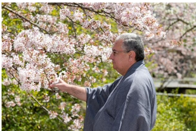
Любование сакурой, Киото, апрель 2022 г.

Нет лучшего способа избавиться от стресса, чем съездить на природу, прогуляться в лесу или по побережью, подышать свежим воздухом. Например, в Японии мне помогают горячие источники: представьте, ты сидишь в горячей воде с температурой 42 градуса, а голова в это время находится на свежем воздухе при температуре 15 градусов. Такая связь с природой в прямом смысле слова эффективно снимает стресс и восстанавливает.