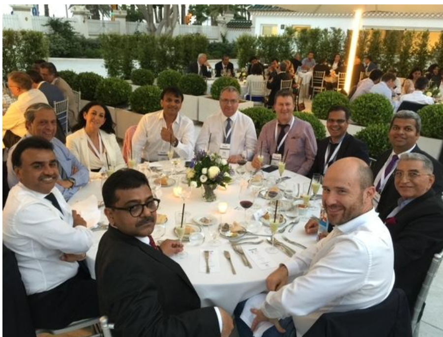
Общение с иностранными коллегами на полях международной конференции, Интерлакен, Швейцария, октябрь 2017 г.

Если речь идет о выстраивании взаимодействия с сотрудниками внутри единого коллектива, то, в первую очередь, это должны быть профессиональные люди. Желательно, чтобы они обладали высокими моральными качествами, что не всегда совпадает. Таких людей надо искать.