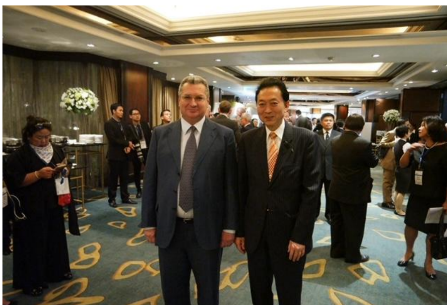
Сергей Демин и бывший премьер-министр Японии Юкио Хатояма, 2017 г.

Список людей, которых я знал длительный период времени и имел возможности для неформального общения, мог бы продолжить. Некоторые японские и российские имена не называю намеренно.