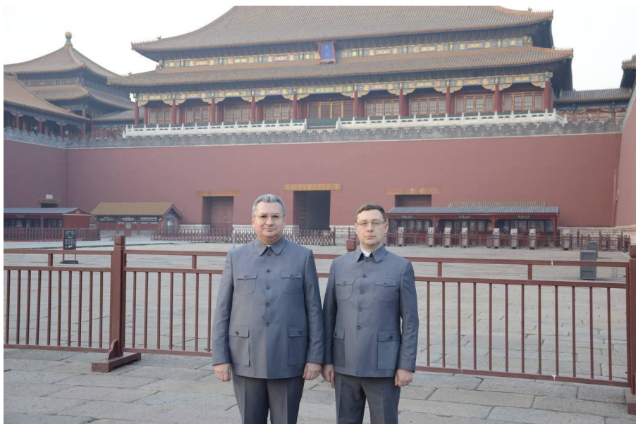
В «Запретном городе», Пекин, декабрь 2016 г.

Сегодня у меня есть мечта: очень хотел бы отправиться в путешествие на Тибет. Я с детства соприкоснулся с Востоком и по профильному образованию являюсь востоковедом. Для меня Тибет — это некая квинтэссенция восточной философии и восточных практик. Кроме того, это один из уголков мира, наименее затронутый цивилизацией. Как мне кажется, одно из мест силы. Разумеется, для подобного путешествия требуется достаточно много времени и предварительная подготовка. Надеюсь, что когда-нибудь смогу и это сделать тоже.