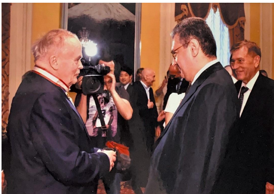
Поздравление Академика Е.П. Велихова с вручением японского ордена Восходящего солнца, Посольство Японии в Москве, 2016 г.

Горд знакомством и продолжаю общение с Академиком Евгением Павловичем Велиховым, являющимся отцом Проекта ITER ( International Thermonuclear Experimental Reactor — проект международного экспериментального термоядерного реактора, который строится во Франции с 2007 г. как прототип будущих установок, в которых энергия будет вырабатываться в высокотемпературной плазме при синтезе изотопов водорода — Прим. ред. ). Общался с Михаилом Тимофеевичем Калашниковым (советский и российский конструктор стрелкового оружия — Прим. ред.).