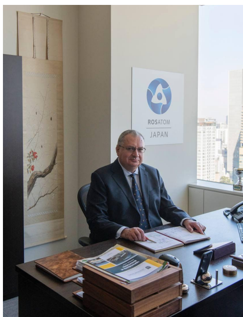
В офисе филиала «Росатом Япония», ноябрь 2022 г.

Мне предложили возглавить региональный центр «Росатома» в Пекине — «Росатом Восточная Азия», который должен был заниматься тремя странами: Китаем в качестве основного направления, Японией и Монголией. Это был абсолютно новый центр, успешно созданный с нуля. Я проработал в Пекине три с половиной года. Это был очень интересный опыт. Так, в период нашей работы в июне 2018 г. был подписан «контракт века» на постройку четырех атомных реакторов в Китае. Подобных единоразовых сделок в мировой атомной отрасли практически и не было. На сегодняшний день осуществляется реализация данного контракта.