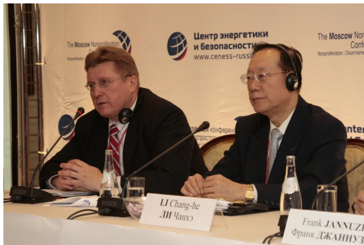
2010 год, Московская конференция по нераспространению, Москва (Россия).