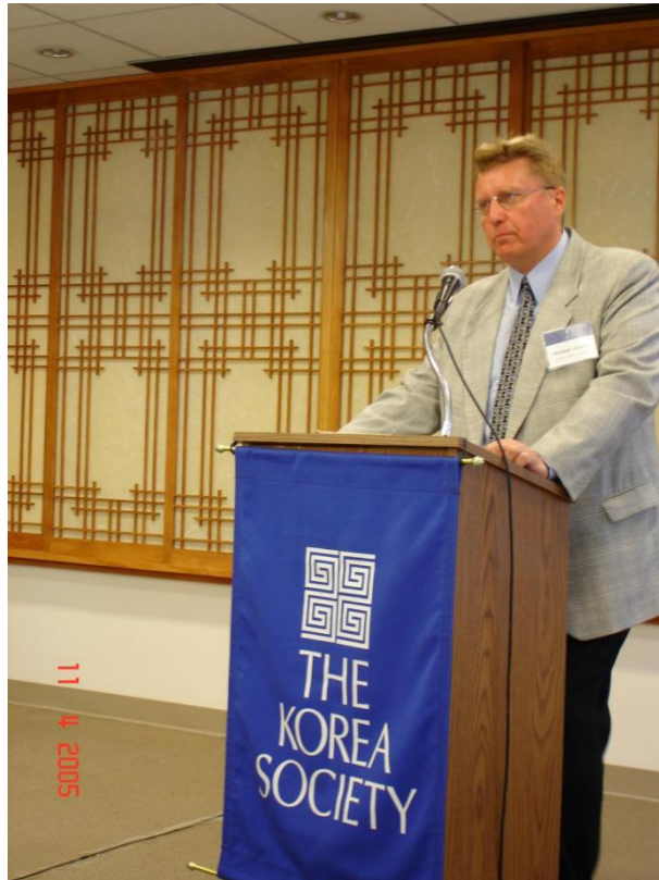
2005 год, Корейское общество, Нью-Йорк (США).