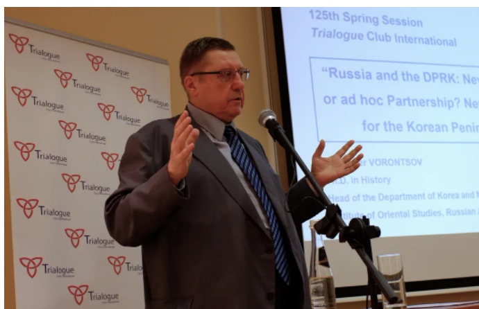
7 апреля 2025 года, выступление на 125-ом заседании международного клуба «Триалог», Москва (Россия)

О ПИР-Центре я узнал в конце 1990-х, когда корейская ядерная программа стала актуальной. ПИР-Центр объединил ведущих физиков-ядерщиков, специалистов по ракетно-ядерным технологиям и корееведов-международников, и я высоко ценю наше сотрудничество.