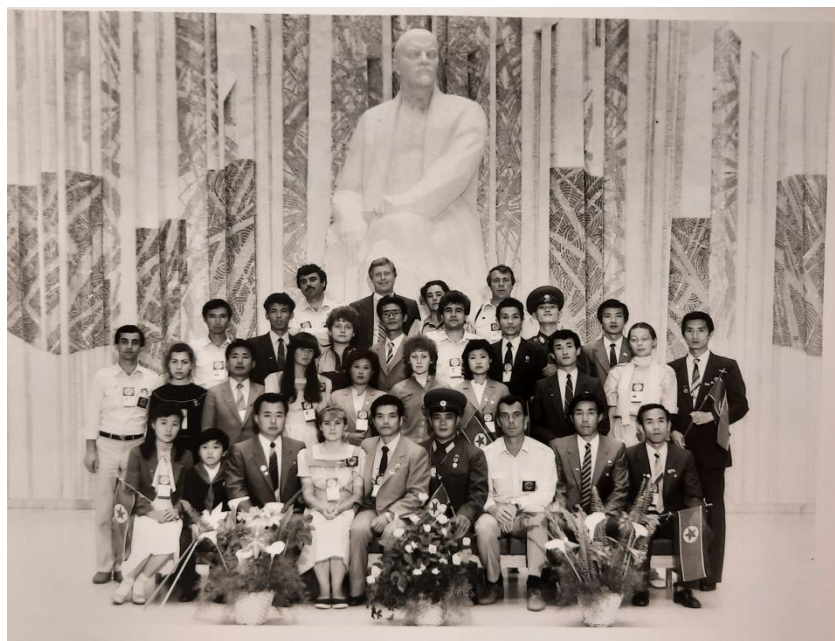
1986 год, I Фестиваль дружбы молодёжи СССР и КНДР, Ульяновск (СССР).

В самом начале налаживания отношений СССР с Южной Кореей я работал переводчиком на Кубке мира по марафонскому бегу в Сеуле в апреле 1987 г., где советская женская команда завоевала золото. На пресс-конференции, поскольку тогда хорошо знающих русский язык корейцев не нашлось, меня попросили переводить. К моему удивлению, на следующий день статья в Seoul Daily Sport была посвящена не столько спортсменам, сколько мне, где с удивлением отмечалось, что я отвечал на вопросы корейских журналистов непосредственно на корейском языке, и в самом конце восторженного отзыва подчеркивалось «с северокорейским произношением». Конечно, это было свидетельство качественного образования в МГУ. В том же году я сопровождал советских гребцов в Пусан на предолимпийские соревнования. Однако особенно мне запомнилось общение с местными жителями на рынке. Один пожилой кореец, не знавший иностранных языков и тем более русского, рассказал, как его родители передавали ему, что в 1905 году они несколько дней не могли спать из-за криков русских моряков со стороны Цусимского пролива. И слово «помогите» он произнес «коряво», но узнаваемо по-русски. Такие моменты врезаются в сердце и память и подтверждают, что моя профессия востребована.