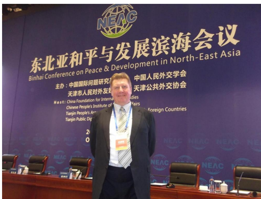
2014 год, Биньхайская конференция по вопросам мира и развития в Северо-Восточной Азии (англ. Binhai Conference on Peace & Development in North-East Asia), Тяньцзинь (КНР).

Также в свободное время я увлекаюсь посещением музеев. В командировках я всегда нахожу время для Лувра в Париже, Метрополитена в Нью-Йорке, музея Чингисхана в Монголии или Вашингтонской галереи. В прошлом году я посетил буддийский монастырь Ламы Чойчжин в центре Улан-Батора и был впечатлён высоким художественным уровнем буддийской бронзы. Будучи в Вашингтоне с семьёй, мы любили начинать воскресенье с посещения православной церкви, а затем осмотра музеев на Национальном Молле, завершая вечер на бесплатном концерте классической музыки в Вашингтонской галерее.