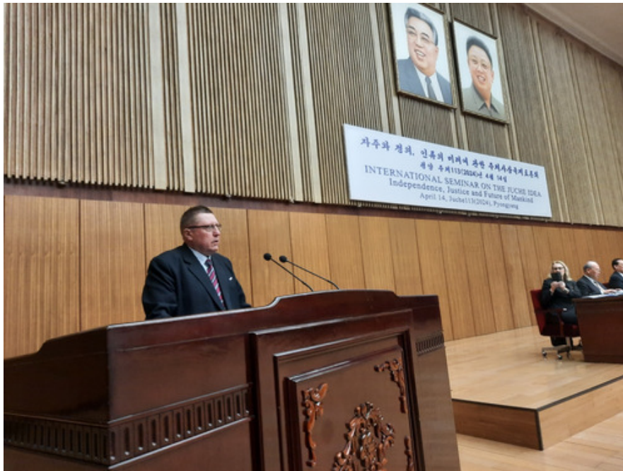
2024 год, Выступление с докладом на тему «Россия в борьбе за суверенитет, независимость и справедливое будущее человечества», Международный семинар по изучению идей чухче (англ. International Seminar on the Juche Idea. Independence, Justice and Future of Mankind), Пхеньян (КНДР).