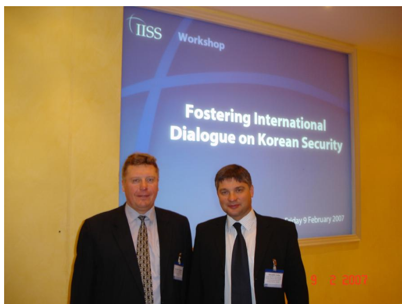
2007 год, Международный институт стратегических исследований (англ. International Institute for Strategic Studies, IISS ), Лондон (Великобритания).