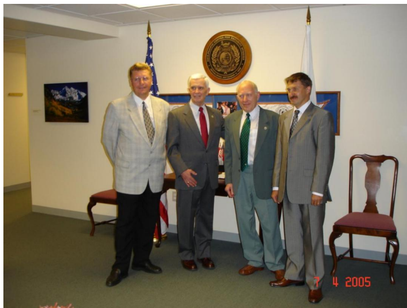
2005 год, Азиатско-Тихоокеанский центр исследований в области безопасности (англ. Asia-Pacific Center for Security Studies, APCSS), Гонолулу (Гавайи).

Вспоминается, например, эпизод, когда после выступления в Гонолулу исполнительного директора международной Организации содействия развитию энергетики на Корейском полуострове (КЕДО) посла Чарльза Картмана, который отметил, что «если иметь терпение, то с северокорейцами можно находить общий язык», я ему сказал: «Вы – первый американец, от которого я услышал такое важное слово «терпение». Он сразу протянул мне руку и сказал: «Давайте дружить, когда будете в Нью-Йорке, обязательно мне звоните». Там мы с ним и встретились повторно.