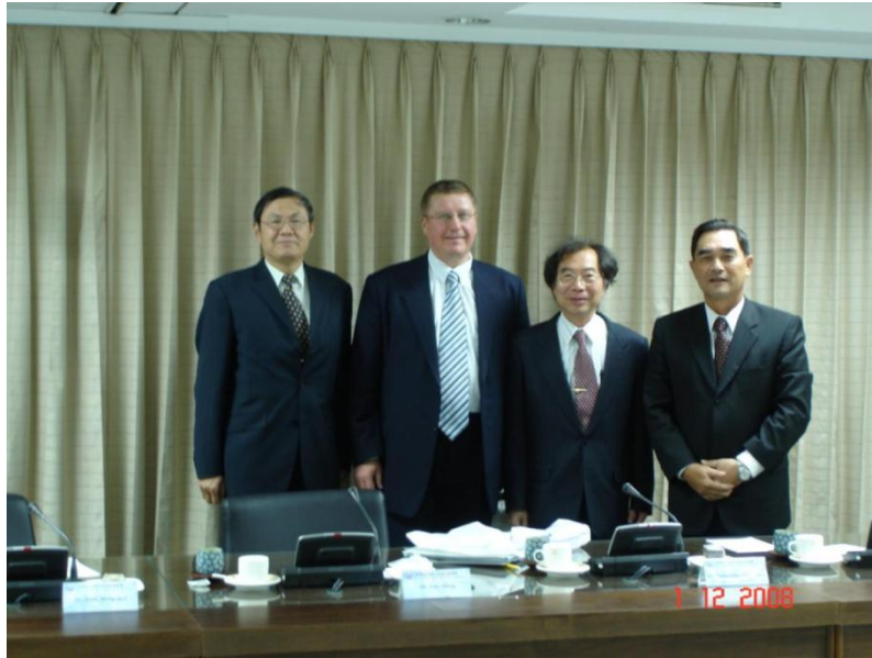
2008 год, Тайвань.