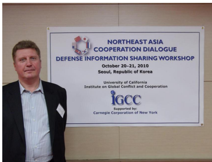
2010 год, Северо-Восточноазиатский диалог о сотрудничестве (англ. The Northeast Asia Cooperation Dialogue, NEACD), Сеул (Республика Корея).