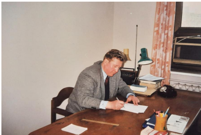
2000 год, Кабинет в Посольстве РФ в КНДР

Судьба распорядилась таким образом, что в марте 2000 г. я завершил профессорскую деятельность в Сеуле, а в октябре того же года прибыл в Пхеньян для прохождения службы в Посольстве РФ в КНДР в качестве второго секретаря.