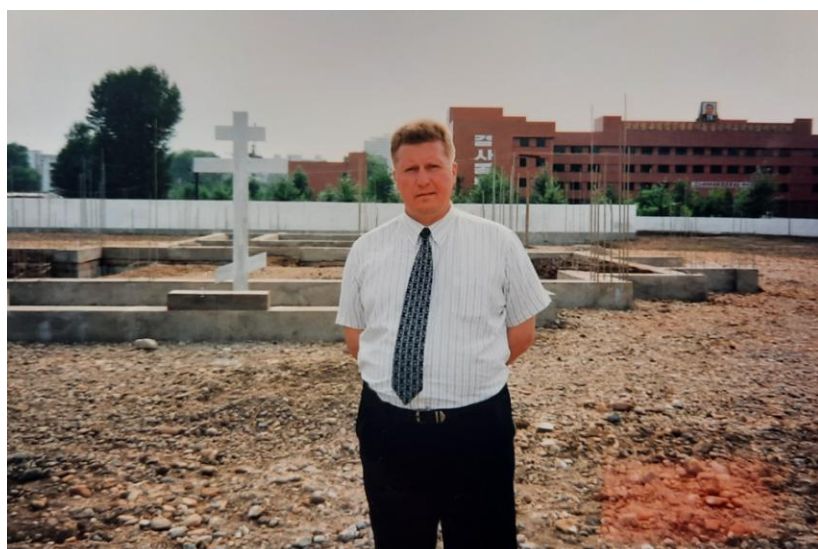
2003 год, Храм Троицы.

Работа переводчиком с иностранными делегациями дала ценную языковую практику. Помню, как в 1980-х гг. одна из северокорейских делегаций кинематографистов была шокирована, узнав, что в СССР не запрещена религия.