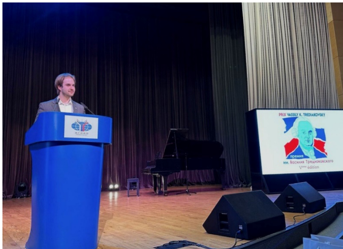
Финал V конкурса ораторского мастерства имени Василия Третьяковского, апрель 2024 г.

Одним из самых важных моментов моего опыта в МГИМО был конкурс ораторского мастерства имени В. Третьяковского, который мы организуем ежегодно. Это был очень сложный, но стоящий того опыт – организовать такое мероприятие с более чем 100 участниками и жюри из франкоязычного дипломатического, делового и культурного сообщества Москвы. Наш первый конкурс в 2023 году открыл нам двери для участия в саммите Россия-Африка 2023 года и Всемирном фестивале молодежи 2024 года.