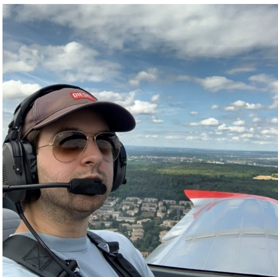
Пилотирую самолет

С детства моим главным увлечением всегда была авиация. Я начал летать на планерах в 14 лет, и сейчас я близок к завершению обучения на частного пилота во Франции (PPL), где летаю на самолетах Sonaca 200 и Robin DR200 .