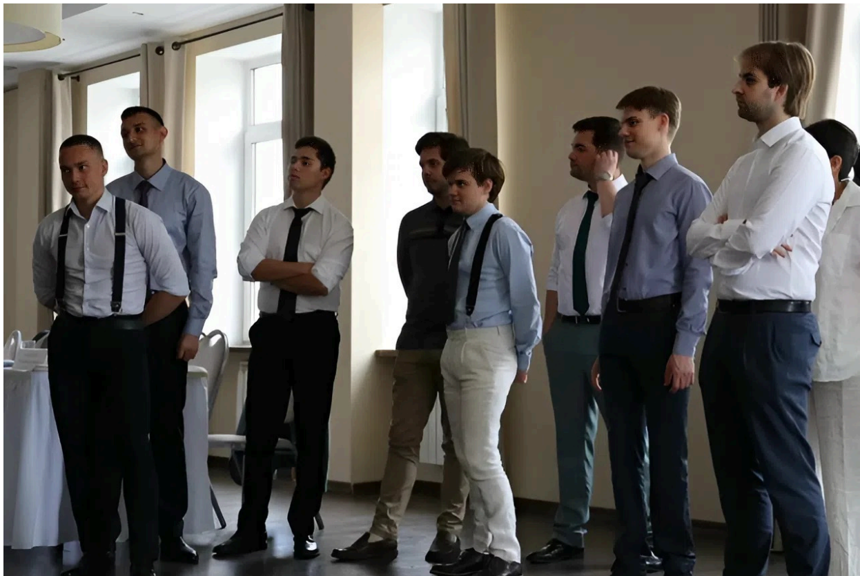
XXIII Международная школа по проблемам глобальной безопасности в Звенигороде, июнь 2024 года

Я бы посоветовал российским коллегам продолжать интересоваться международными отношениями и быть открытым для других людей и культур. Важно наводить мосты между странами, связывать себя с миром и активно участвовать в нем. Есть так много возможностей для культурного и экономического сотрудничества, которые еще предстоит полностью изучить и использовать! Используйте свои студенческие годы не только для учебы, но и для участия в проектах, ассоциациях и мероприятиях.