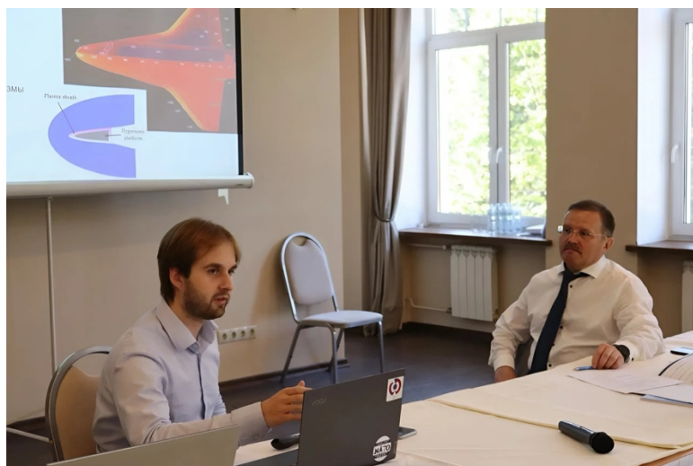
XXIII Международная школа по проблемам глобальной безопасности в Звенигороде, июнь 2024 года

После возвращения в Москву у меня также была возможность довольно много путешествовать по России! Я несколько раз ездил в Санкт-Петербург, город, которым я восхищаюсь за его культурное наследие. У меня также была возможность поехать в отпуск в Сочи (как на пляж, так и покататься на лыжах), а также в Калининград.