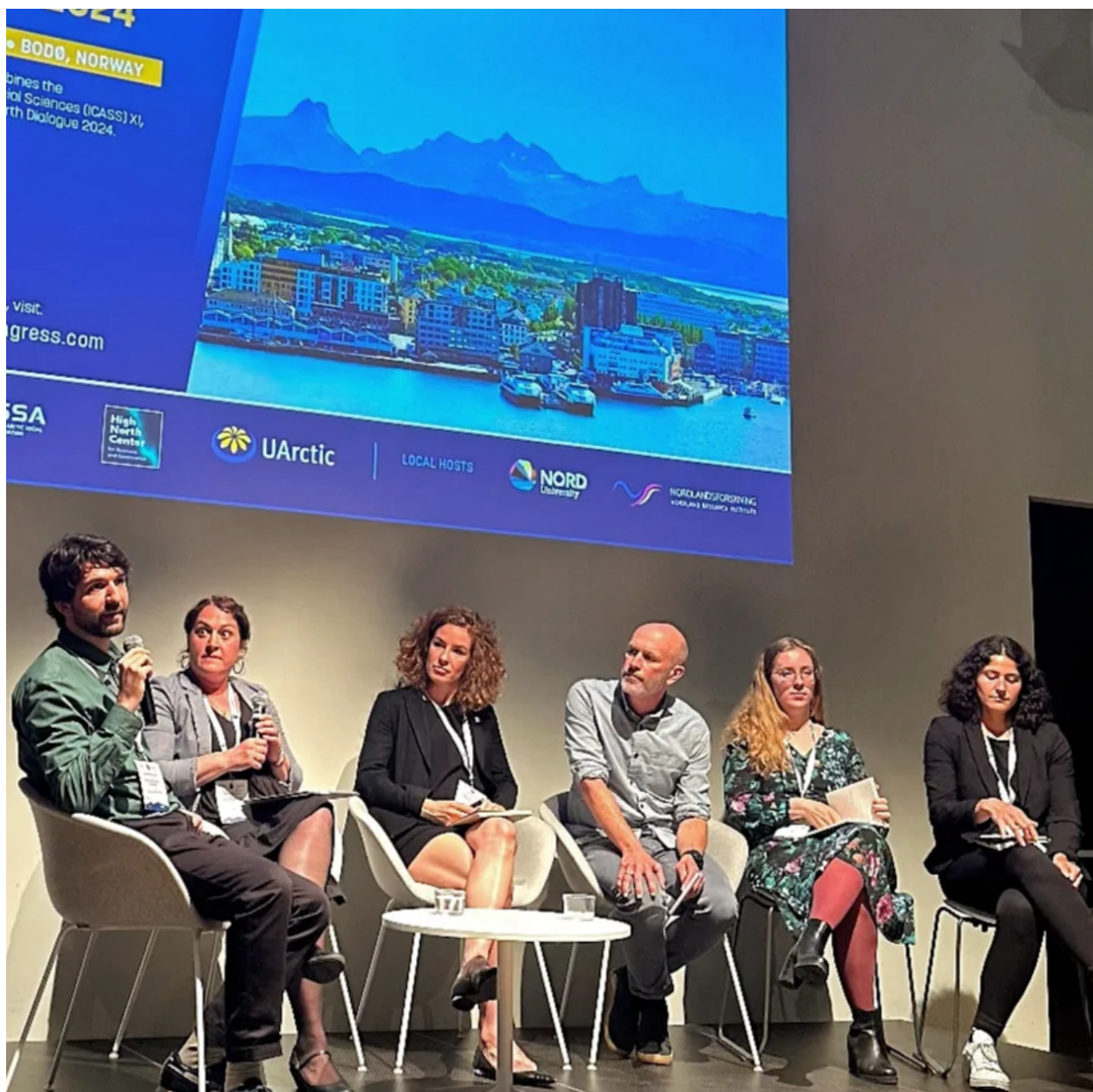
Выступление на конференции «Арктический конгресс» в Буде, Норвегия. 2024 год

Интерес к Арктике начал формироваться еще во время моего обучения в Лондоне. На календаре был 2014 год – период серьезного ухудшения отношений между Россией и Западом на фоне украинского кризиса. Однако, обращая внимание на арктическую повестку, я заметил совершенно другую динамику. Несмотря на политическое напряжение, Россия и США продолжали активно сотрудничать в регионе.