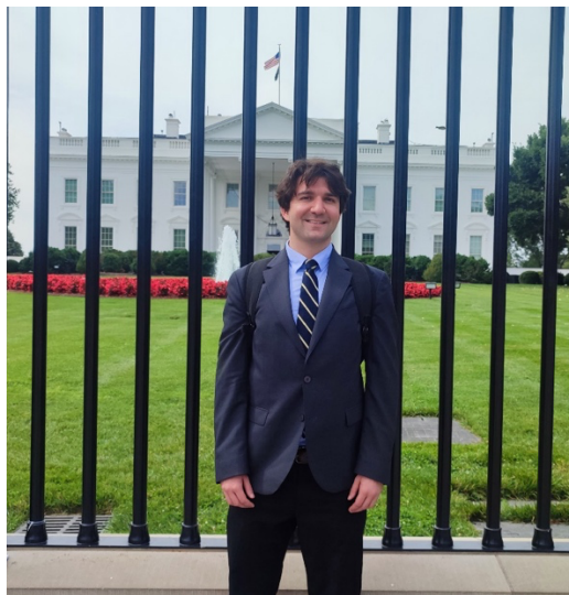
Перед Белым домом, 2025 год

Арктический институт объединяет молодых исследователей, которые изучают регион с точки зрения мира, безопасности, справедливости и устойчивого развития. Для меня большая честь работать в такой команде.