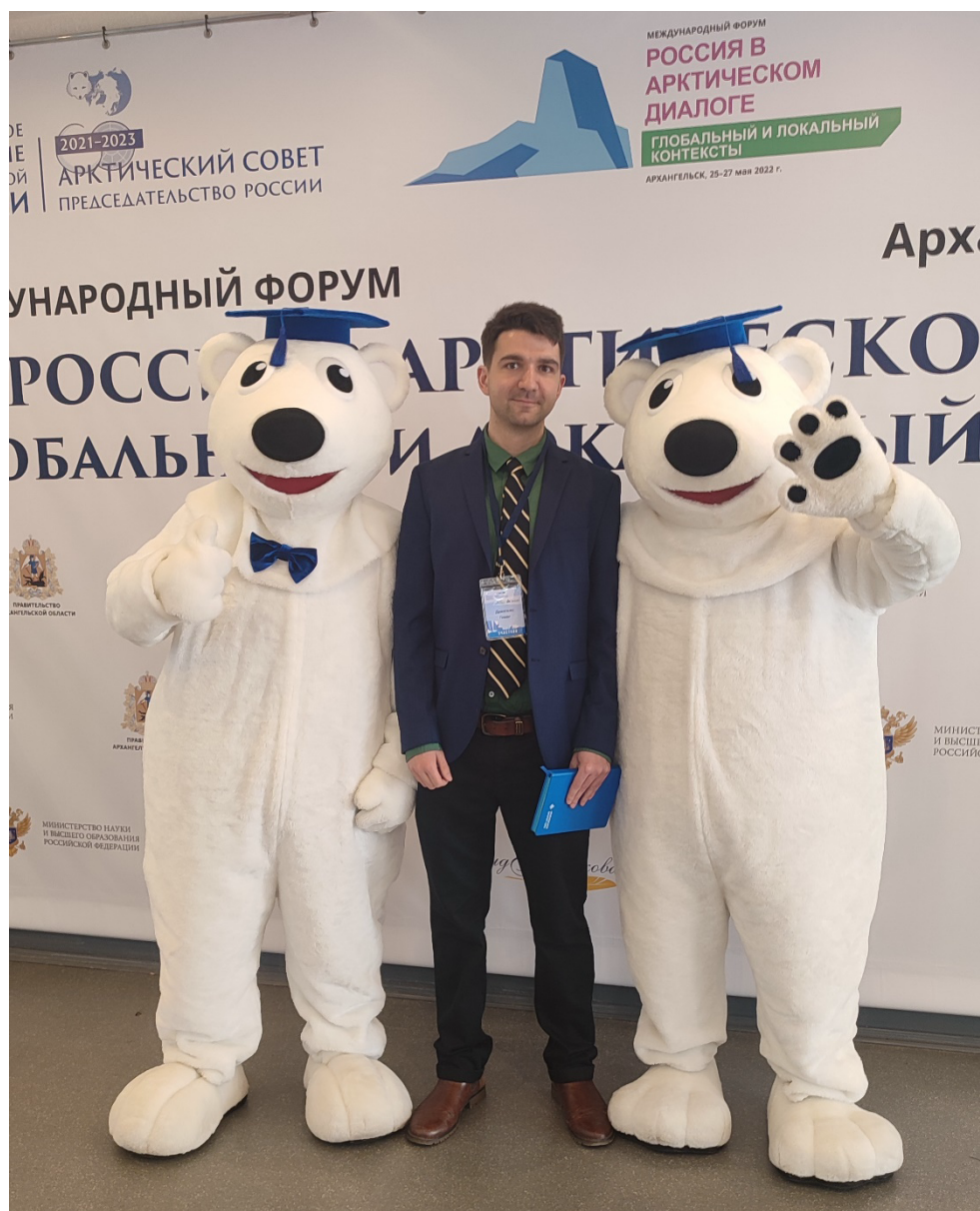
С белыми медведями на форуме «Россия в арктическом диалоге» в Архангельске, 2022 год