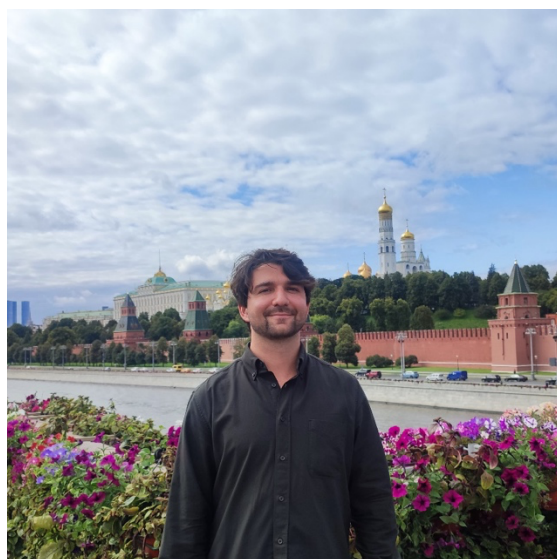
Перед зданием Кремля, 2025 год