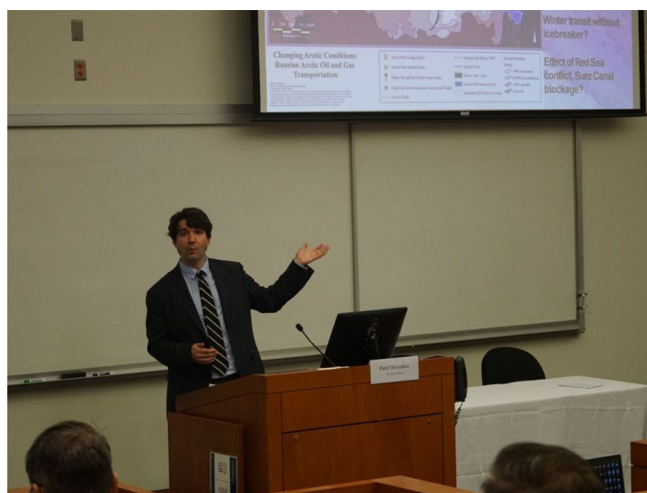
Выступление в Университете Джорджа Вашингтона, 2025 год

Особенно важным для меня стало решение остаться в России в 2022 году, когда многие иностранные коллеги испытывали серьезное давление и покидали страну. Это позволило мне глубже понять российскую реальность и сохранить профессиональные связи. Я убежден, что в международных отношениях присутствие имеет значение: мосты невозможно строить на расстоянии.