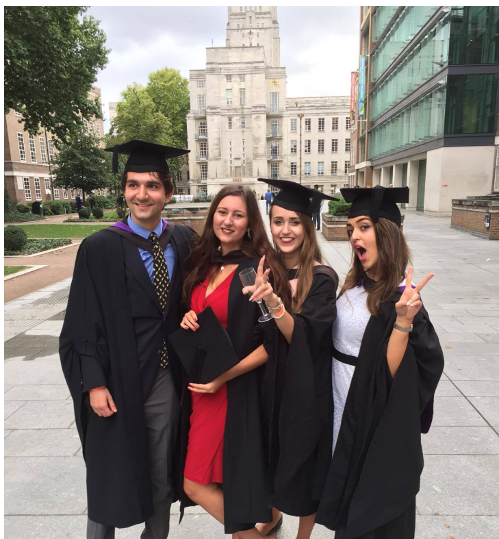
Выпускной в Университетском колледже Лондона, 2017 год

Я получил университетское образование в Лондоне: бакалавриат окончил в Университетском колледже Лондона (UCL), а магистратуру – в Лондонской школе экономики (LSE). Во время учебы я сосредоточился на российской внешней политике, экономике развития, русской философии и международной экономике. Сегодня мне особенно приятно осознавать, что именно эти темы я теперь преподаю студентам НИУ ВШЭ.