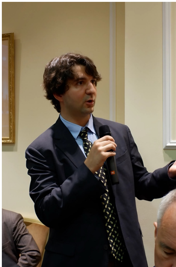
126-ое летнее заседание Международного клуба Триалог, посвященное теме «Какое будущее у российско-американских отношений?», 2025 год

исследования с практическим взаимодействием с политикой и активно инвестирует в подготовку нового поколения специалистов.