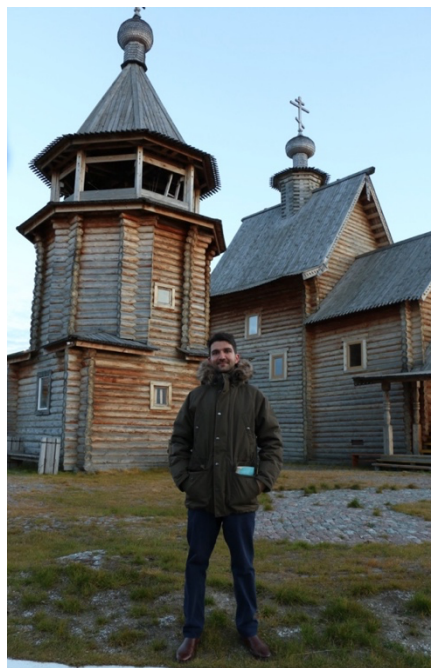
На фоне Обдорского острога, Ямало-Ненецкий автономный округ, 2021 год

В 2021 году я переехал в Москву, чтобы находиться здесь во время председательства России в Арктическом совете (2021-2023). Это решение, как мне кажется, помогло мне утвердиться как специалисту в данной области.